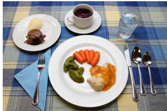
Les portions sont congelées individuellement.

lundi au vendredi 8 h 30 à 12 h 00 13 h 00 à 16 h 30 819.472.6101